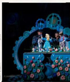
14.01.2023 g. 16:00 Złodziej czasu