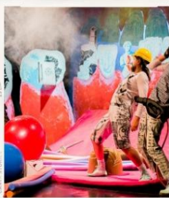
22.01.2023 g. 16:00 Coś na ząb