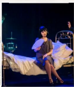
21.01.2023 g. 19:00 Hemar z homarem. Szlagiery przedwojennego kabaretu