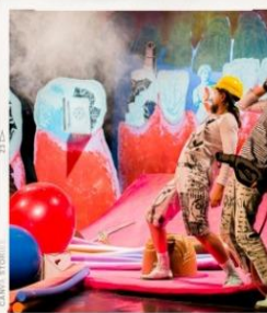
15.01.2023 G. 16:00 Coś na ząb