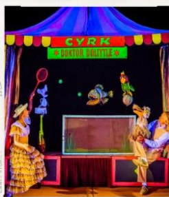
07.01.2023 g.16:00 Cyrk Doktora Dolittle