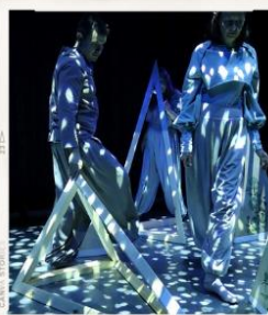
29.01.2023 g. 16:00 Do góry