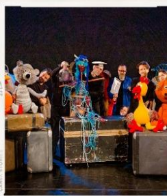
28.01.2023 g. 16:00 Piosenki z kufra