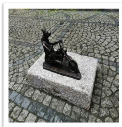
fol. UM JG