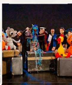
28.01.2023 g. 16:00 Piosenki z kufra