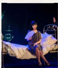
21.01.2023 g. 19:00 Hemar z homarem. Szlagiery przedwojennego kabaretu