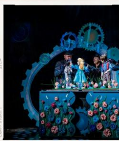
14.01.2023 g. 16:00 Złodziej czasu