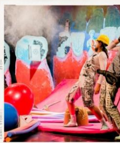
15.01.2023 G. 16:00 Coś na ząb