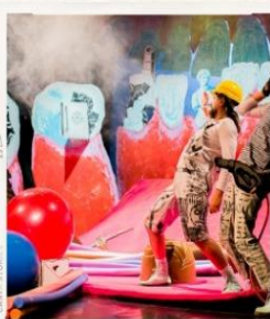
22.01.2023 g. 16:00 Coś na ząb