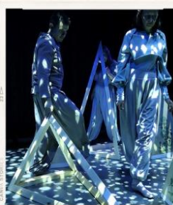
29.01.2023 g. 16:00 Do góry