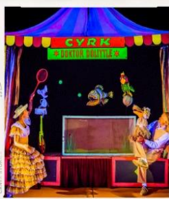
07.01.2023 g. 16:00 Cyrk Doktora Dolittle