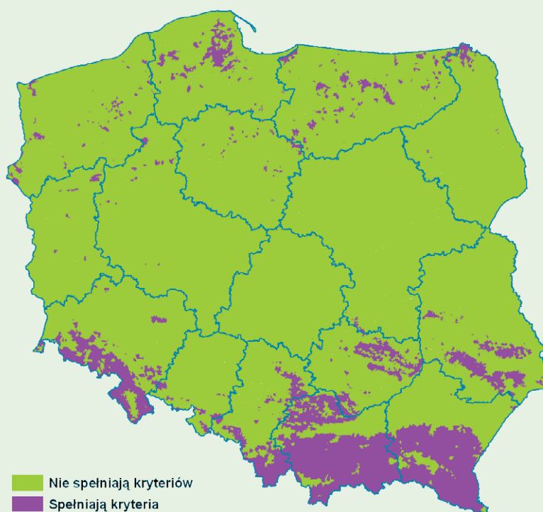
Ryc. 1. Wykaz obszarów zagrożonych erozją wodną