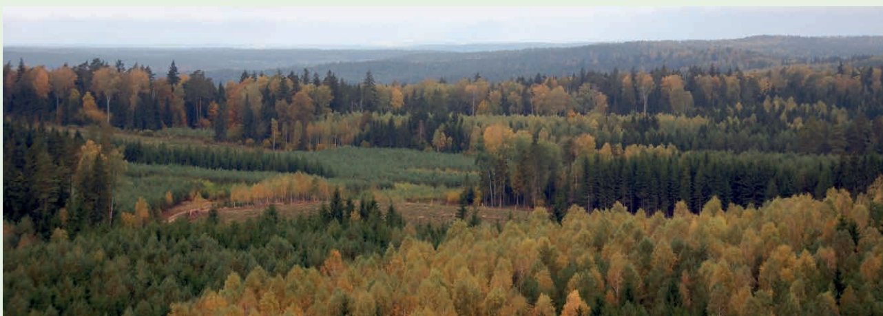
fol. M. Paradowski

W przypadku poddziałania 8.1 (w zakresie premii pielęgnacyjnej i premii zalesieniowej) – zmniejszenie pomocy następuje również w sytuacji, gdy rolnik, który zalesił grunty, nie przestrzega w całym gospodarstwie wymogów i norm określonych w przepisach o płatnościach w ramach systemów wsparcia bezpośredniego (wymogów wzajemnej zgodności). Wówczas zmniejszeniu podlega premia pielęgnacyjna i premia zalesieniowa za dany rok kalendarzowy, której wysokość jest ustalana procentowo zgodnie z przepisami o płatnościach w ramach systemów wsparcia bezpośredniego.