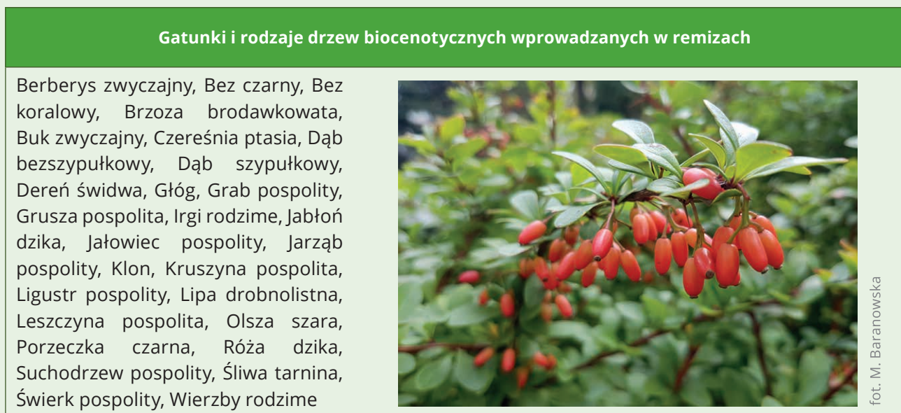
Tabela 5. Gatunki rodzime drzew i krzewów wykorzystywanych w przypadku zakładania remizy

Ponadto skład gatunkowy musi odzwierciedlać dobór gatunków dostosowany do warunków siedliskowych, środowiskowych i klimatycznych. Podczas doboru gatunków powinno się zwracać uwagę na ich zdolności do rozwoju w danych warunkach. Należy również przestrzegać Zasad Hodowli Lasu w zakresie norm określających proporcję gatunków na różnych typach siedliskowych lasu, liczbę drzew na hektar i więźbę.