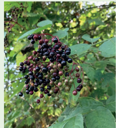
fol. E. Budka

Skład gatunkowy uprawy leśnej jest ustalany przez leśnika i opisany w planie zalesienia. Nadleśniczy ustalając skład gatunkowy bierze pod uwagę rolniczą klasyfikację gruntów rolnych oraz regionalizację przyrodniczo-leśną w celu dostosowania zalesień do lokalnych warunków siedliskowych, z tym że do zalesień wykorzystywane mogą być tylko rodzime gatunki drzew i krzewów, określone w tabeli 2. Ponadto skład gatunkowy musi odzwierciedlać dobór gatunków dostosowany do warunków siedliskowych, środowiskowych i klimatycznych. Podczas doboru gatunków powinno się zwracać uwagę na ich zdolności do rozwoju w danych warunkach. Należy również przestrzegać Zasad Hodowli Lasu w zakresie norm określających proporcję gatunków na różnych typach siedliskowych lasu, liczbę drzew na hektar i więźbę.