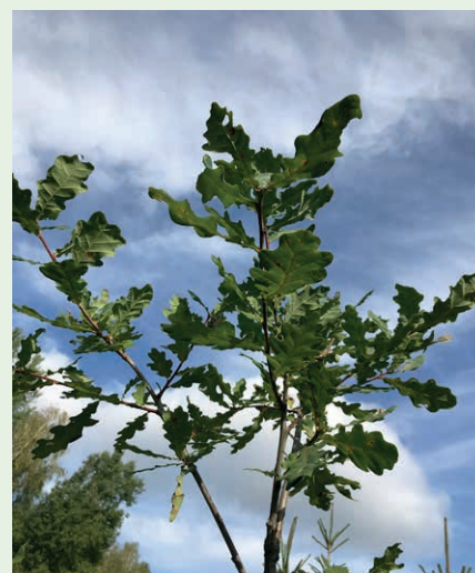
fol. E. Budka

Celem planu zalesienia jest wyposażenie rolnika w fachową informację na temat wykonania zalesienia oraz zabiegów pielęgnacyjnych na założonej uprawie leśnej lub gruntach z sukcesją naturalną, które mają być wykonywane przez 5 lat. Plan zalesienia sporządzany jest oddzielnie dla każdego kompleksu obejmującego grunty przeznaczone do wykonania zalesienia lub grunty z sukcesją naturalną i powinien zawierać podpis nadleśniczego, który sporządził ten plan. Jego egzemplarz powinien być przechowywany u rolnika, a kopia w Nadleśnictwie. Ponadto, kopia planu zalesienia (potwierdzona za zgodność z oryginałem przez nadleśniczego, który sporządził ten plan) dołączana jest do wniosku o przyznanie wsparcia na zalesienie lub do wniosku o przyznanie pierwszej premii pielęgnacyjnej do gruntów z sukcesją naturalną na których, zgodnie z planem zalesienia nie jest wymagane dolesienie.